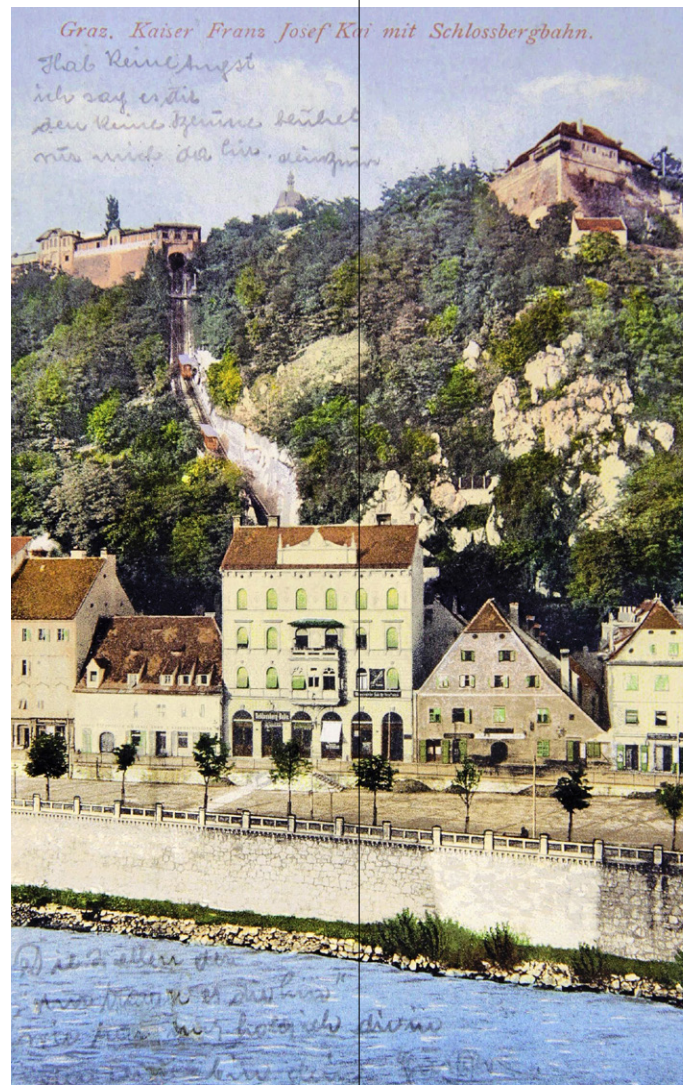
Blick von Westen auf den Schlossberg, 1909

Ein weiteres Schutzinstrumentarium in Graz ist das Grazer Altstadterhaltungsgesetz. Die Anlage liegt in der Schutzzone I nach dem Grazer Altstadterhaltungsgesetz. Diese Zone erstreckt sich über ca. einen Quadratkilometer der Stadtfläche und umfasst die historische Kernstadt innerhalb der ehemaligen Renaissancebefestigung mit dem Schlossberg und Teilen der Murvorstadt. Die Schutzzone entspricht auch der UNESCO-Welterbe-Zone Graz und somit dem historischen Zentrum. Doch all das kann ein Objekt noch nicht retten. Der schlechte Bauzustand sorgte immer wieder für alarmierende Warnrufe aus der Bevölkerung und in Fachkreisen.